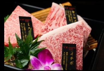
極上近江牛ステーキ3種盛

近江牛ホルモン盛り合わせ 3種盛 (たれ or 塩胡椒 どちらかお選びください)