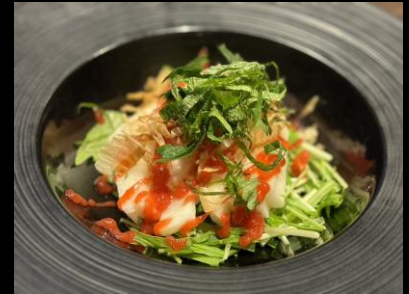
長芋の梅しそサラダ