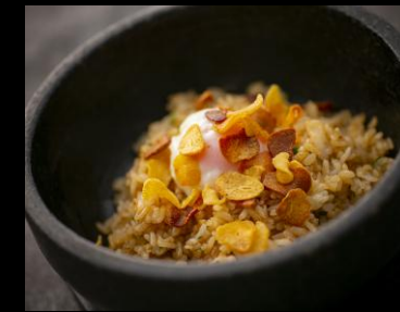
ガーリックライス