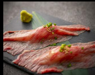
近江牛ローストの炙り握り寿司