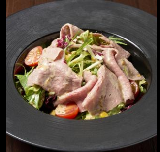
近江牛 冷しゃぶサラダ