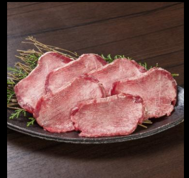
万葉特選上タン (国産)