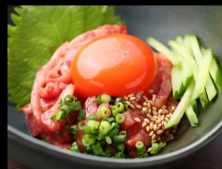
近江牛特選レアステーキユッケ風