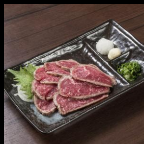
近江牛レアステーキタタキ風