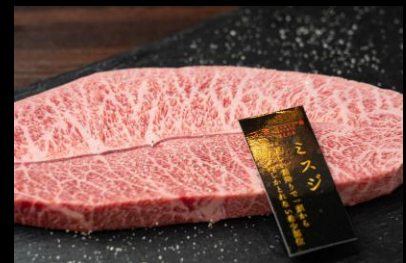
近江牛ミスジステーキ