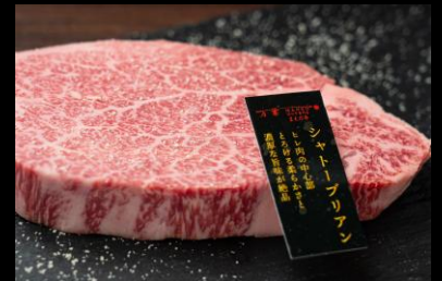
近江牛シャトーブリアン