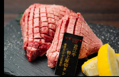
近江牛特上厚切りタン