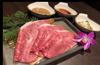
近江牛 特選焼きしゃぶ