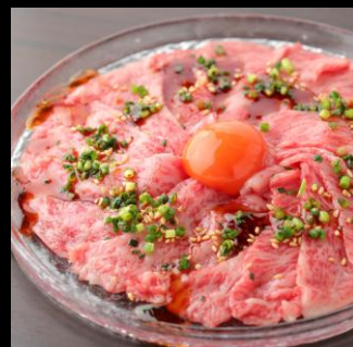
近江牛サーロイン薄切りユッケ風