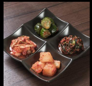
キムチ4種盛り合わせ