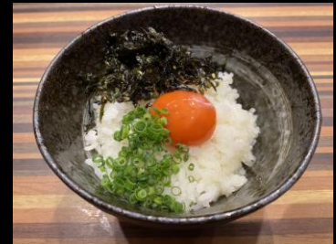
ガンコ卵かけご飯