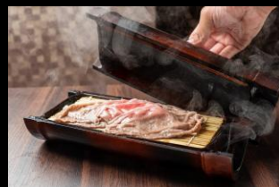
近江牛 せいろ蒸し