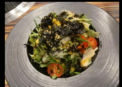
韓国チョレギサラダ