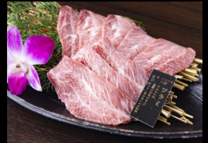
近江牛ツラミ (頬肉)