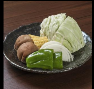
焼き野菜盛り合わせ