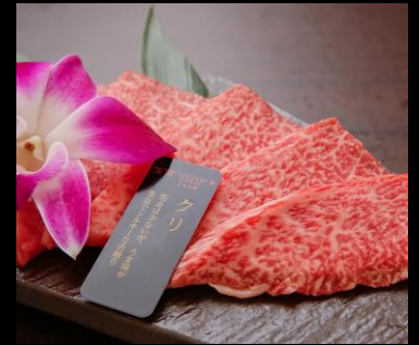
近江牛 特選上赤身